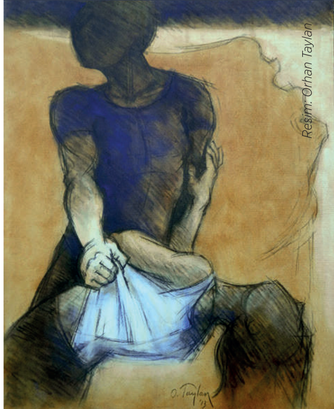
Resim: Orhan Taylan

TÜRK EĞİTİM DERNEĞİ XIV. EĞİTİM TOPLANTISI NOTLARINDAN 29 - 30 Kasım 1990