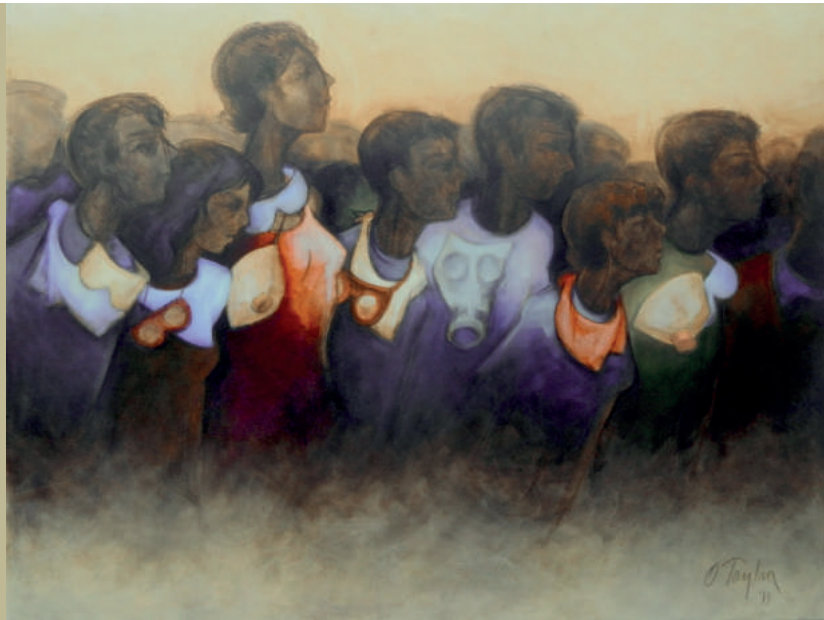
Resim: Orhan Taylan