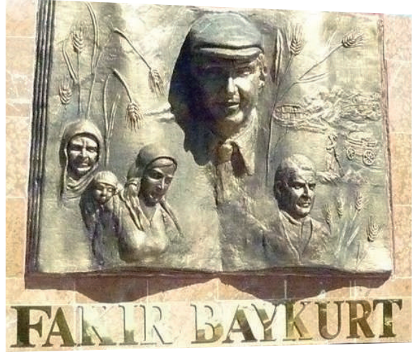
Heykeltıraş Murat Atasoy tarafından yapılan rölyef.

"...Kitaplıkta Nazım Hikmet'in kitapları yoktu. Yasaklandığını öğrenince Denizli Çivril'in bir köyüne gidip onları buldum. Nazım'ın yedi kitabını kendi yaptığım defterlere