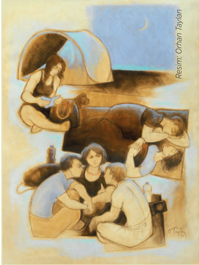
Resim: Orhan Taylan

Kısaca, laik okul, açık ya da kapalı, hatta "dini duyarlılaşma" kisvesi altında sunulan partizan hareketin de, inancı kötüleme amacı güden tartışmacı hareketin de aynı anda reddedilmesini öngörür. Ne dini yüceltmenin ne de militan ateizmin, herkese açık olan kamusal devlet okullarında yeri yoktur. Bu nedendir ki; laik okul hiçbir durumda "sivil toplum liderleri"ne, cumhuriyetçi, ilkelere ya bunun hayata, geçirilmiş biçimi olan laik deontolojiye uygun eğitim verme görevi veremez. Bu noktada, "Kamu eğitimi laiktir. Eğitim kurumlarında hiçbir dini partizanlık türüne izin verilemez."