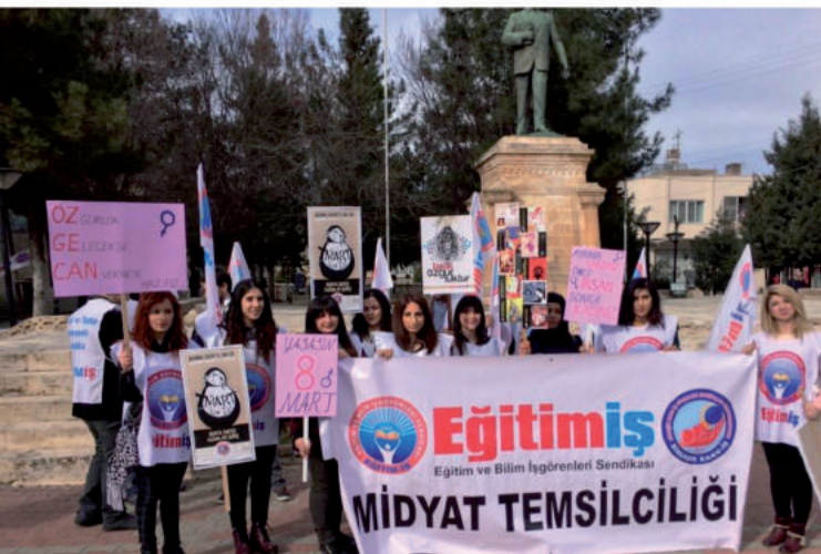
MİDYAT TEMSİLCİLİĞİNİN 8 MART ETKİNLİĞİ

8 Mart Dünya Emekçi Kadınlar Günü nedeniyle Eğitimış Antalya şubesi öncülüğünde BİRLEŞİK KAMU-İŞE BAĞLI BÜROİŞ-TÜM YERELSEN- CUMHURİYET KADINLARI - ADD- CHP KADIN KOLLARI İL VE İLÇE BAŞKANLIKLARI - ŞAH-I MERDAN - ALEVİ KÜLTÜR DERNEKLERİ VE VAKFI - HEMŞERİ DERNEKLERİ VE ANŞOYAD ile birlikte saat 17.30 da Aydın Kanza Parkından başlayarak güllük caddesi üzerinden Cumhuriyet Meydanına yürüyüş yapıldı.